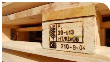
Rysunek 1. Oznaczenie obróbki fitosanitarnej

Oznaczenia obróbki fitosanitarnej – opakowania drewniane (w szczególności palety) importowane na terenie Unii Europejskiej, w tym Polski, muszą być oznakowane zgodnie z wymogami Międzynarodowego Standardu dla Środków Fitosanitarnych numer 15. Spełnienie tego wymogu potwierdza się umieszczeniem na środkowym lub bocznym wsporniku palety specjalnego znaku zatwierdzonego przez IPPC oraz numeru zakładu wykonującego zabieg.